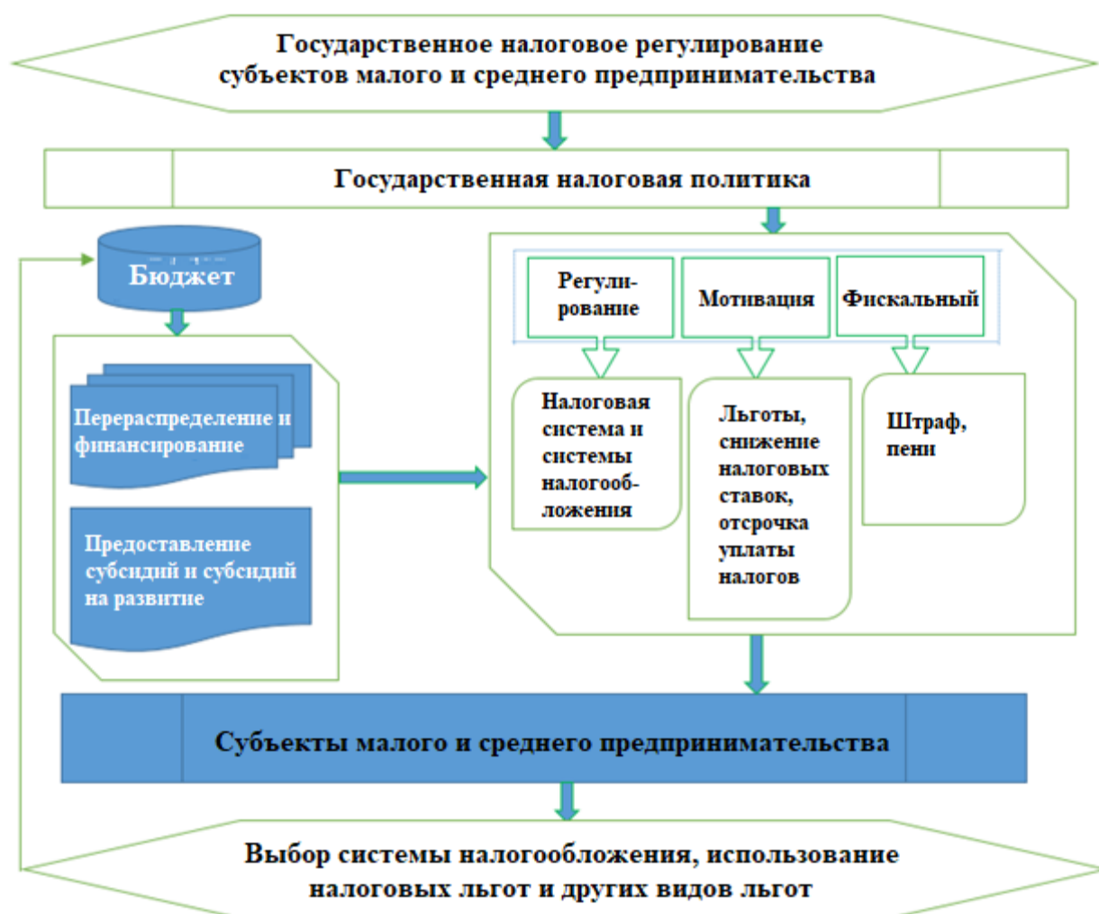
Рисунок 3. – Механизм государственного налогового регулирования субъектов малого и среднего предпринимательства

В исследовании разработан механизм дальнейшего совершенствования государственного налогового регулирования на основе поддержки субъектов хозяйствования, в котором влияние налогового администрирования, организационно-правовых актов, усиление налоговых отношений и цифровизация с учетом систем налогообложения, льготы и упрощения, возможности дальнейшего укрепления малого и среднего предпринимательства, стратегия и перспектива формирования налоговых отношений выражается на основе формирования новых форм хозяйственных отношений (см. рис. 3).