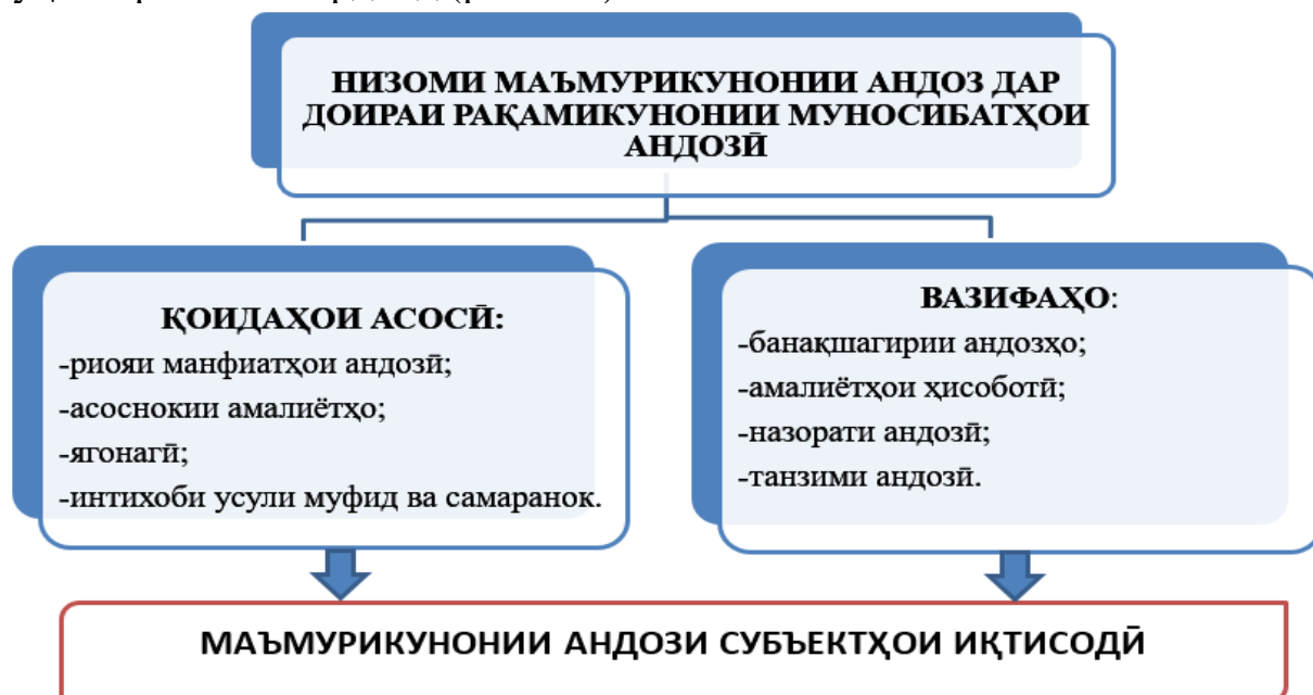
Расми 2. – Қоидаҳо ва вазифаҳои асосии маъмурикунонии андоз дар таъмини танзими низоми андозбандии субъектҳои соҳибкорӣ

маъмурикунонии андозро аз ҳисоби муфид ба роҳ мондани натиҷаҳои корҳои назоратӣ, ҳисоббаробаркунии бақияпулиҳои андоз, баҳисоб гирифтани теъдоди субъектҳои ғайрифаъл ва баинобат гирифтани онҳо хеле муҳим мебошанд, ки онҳо дар омӯзиш ва таҳқиқи қоидаҳои асосӣ ва иҷрои вазифаҳои такмили низоми андозӣ ва маъмурикунонии он низ муҳим арзёбӣ мегарданд (расми 2).