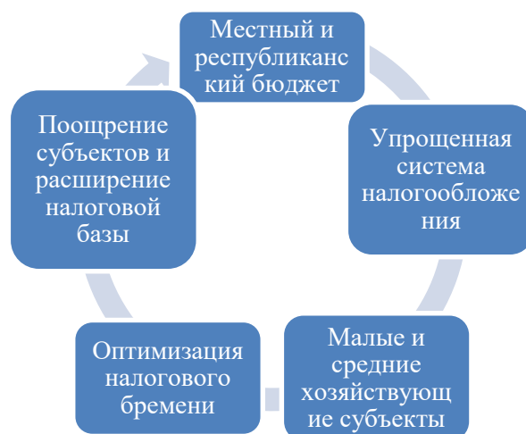
Рисунок 1. – Механизм оценки налогообложения субъектов малого и среднего предпринимательства