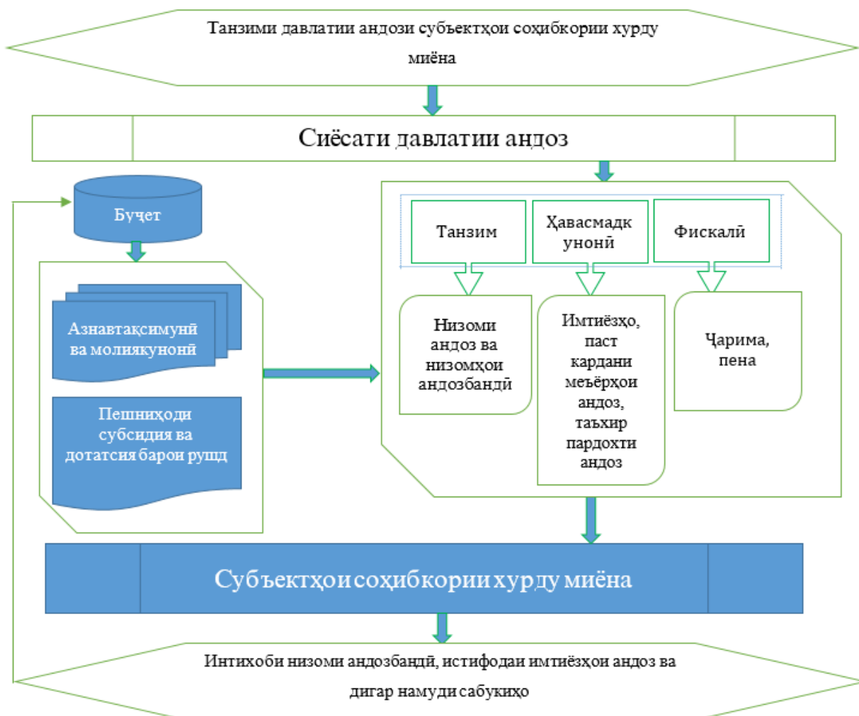
Расми 3. – Механизми танзими давлатии андози фаъолияти субъектҳои соҳибкории хурду миёна

Дар таҳқиқот механизми такмили ояндавии танзими давлатии андоз дар заминаи дастгирии субъектҳои хоҷагидор коркард карда шуд, ки дар он таъсири маъмурикунонии андозҳо, сандаҳои ташкилию ҳуқуқӣ, тақвияти муносибатҳои андозбандӣ ва рақамикунонӣ бо дарназардошти низомҳои андозбандӣ, имтиёзу сабукиҳо, имкониятҳои тақвияти минбаъдаи соҳибкории хурду миёна, стратегия ва ояндабинии ташаккулёбии муносибатҳои андозбандиро дар заминаи ташаккули шаклҳои муносибатҳои нави хоҷагидорирӣ ифода ёфтааст (расми 3).