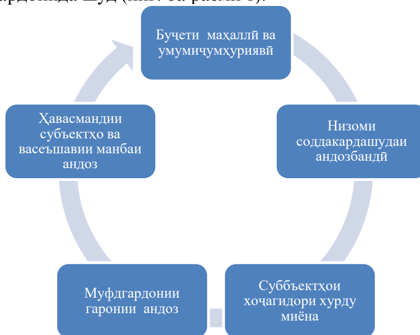
Расми 1. – Механизми арзёбии андозбандии субъектҳои хоҷагидорӣ хурду миёна

Дар рафти таҳқиқот муайян карда шуд, ки фаъолияти воқеии субъектҳои соҳибкорӣ аз таъсири омилҳо ва ташаккул ёфтани занҷираи арзиши илова вобаста буда, дар ин асос манбаи андозбандӣ бо дарназардошти унсурҳои механизми андозбандӣ ҳамчун омили рушд дар низоми идоракунии андозбандӣ баромад мекунад. Бо ин мақсад, механизми арзёбии андозбандии субъектҳои хоҷагидори хурду миёна коркард гардида, бо дарназардошти занҷири арзиши илова ҷиҳати тақвият додани муносибатҳои андозбандӣ муносибати муфидгардонии гаронии андоз барои фаъолияти субъектҳои соҳибкории хурду миёна пешниҳод гардонида шуд (ниг. ба расми 1).