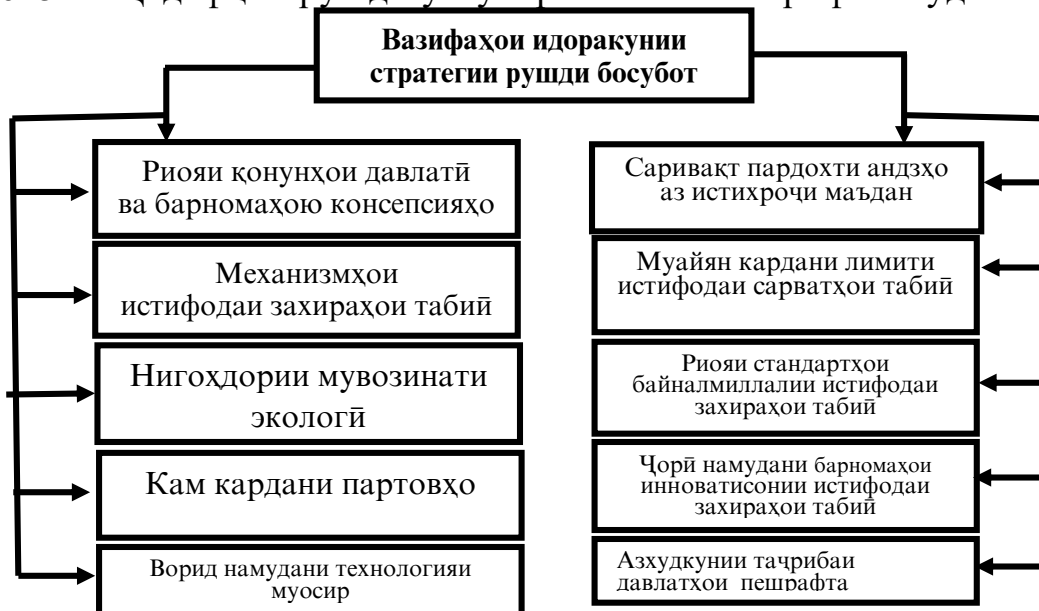
Расми 2. Нишондиҳандаҳо ва вазифаҳои идоракунии стратегияи такмили механизми рушди босуботи менеҷменти муосир.

Дар таҳияи Барномаи рушди иқтисодию иҷтимоии вилояти Хатлон барои солҳои 2021-2025 санадҳои меъёрии ҳуқуқӣ аз ҷумла, Конститутсияи Ҷумҳурии Тоҷикистон, Қонунҳои Конститутсионии Ҷумҳурии Тоҷикистон “Дар бораи мақомоти маҳаллии ҳокимияти давлатӣ”, Қонуни Ҷумҳурии Тоҷикистон “Дар бораи дурнамоҳои давлатӣ, концепсияҳо, стратегияҳо ва барномаҳои рушди иҷтимоию иқтисодии Ҷумҳурии Тоҷикистон”, Стратегияи миллии рушди Ҷумҳурии Тоҷикистон барои давраи то соли 2030, Барномаи миёнамуҳлати рушди Ҷумҳурии Тоҷикистон барои солҳои 2021-2025 ва Ҳадафҳои рушди устувор ба инобат гирифта шудааст.