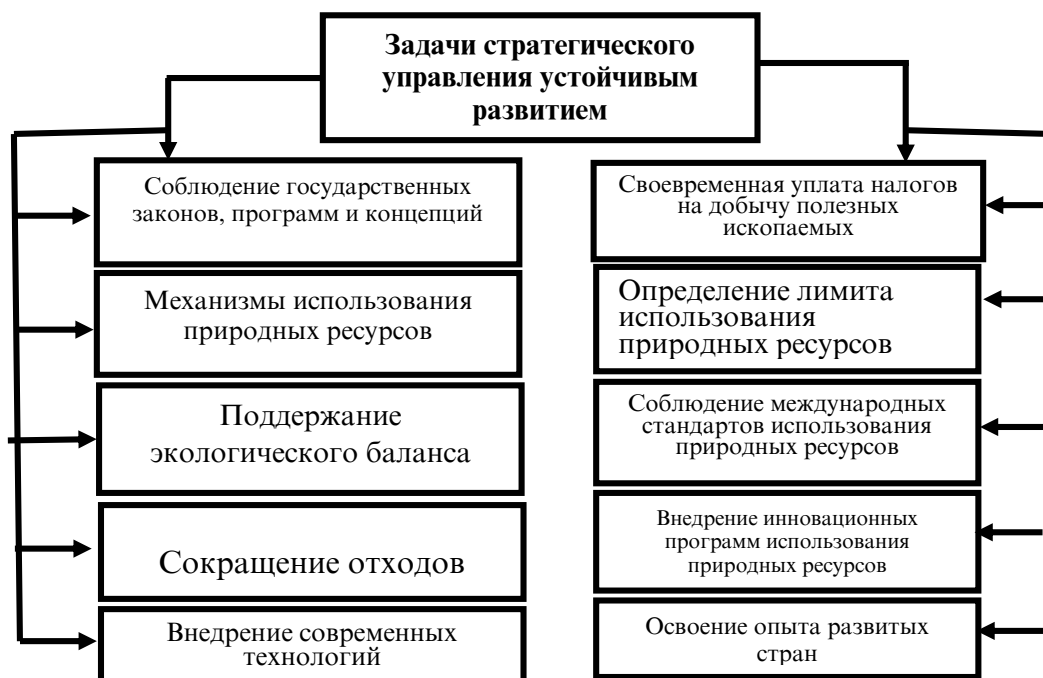
Рисунок 2. Показатели и задачи стратегического управления совершенствованием механизма развития современного менеджмента.

При подготовке Программы экономического и социального развития Хатлонской области на 2021-2025 годы приняты нормативные правовые акты, в том числе Конституция Республики Таджикистан, Конституционные законы Республики Таджикистан «Об органах местного самоуправления», Закон Республики Таджикистан «О государственных перспективах, концепциях, стратегиях и программах социально-экономического развития Республики Таджикистан», Национальная стратегия развития Республики Таджикистан на период до 2030 года, Среднесрочная программа развития Республики Таджикистан на 2021-2025 годы и учтены Цели устойчивого развития.