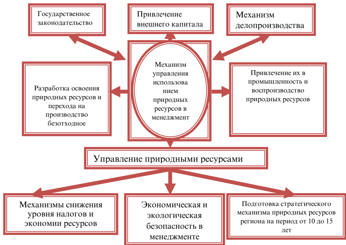
Рисунок 1. Механизм формирования управленческой модели устойчивого развития использования природных ресурсов

Модель механизма формирования современного менеджмента предполагает, что на основе государственного законодательства снижение уровня налогов, привлечение внутреннего и внешнего капитала, привлечение ресурсов в промышленность и другие подобные вопросы по освоению природных ресурсов могут быть решены в полном объеме.