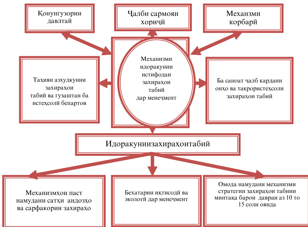
Расми 1. Механизми ташаккули модели идоракунии менеҷменти рушди босуботи истифодабарии захираҳои табиӣ

истифодаи захираҳои табиӣ ва роҳҳои пешгирии офатҳои табииро пешниҳод намудаанд.