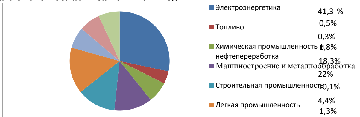
Диаграмма 1. Объем производства промышленной продукции в Хатлонской области за 2021-2022 годы

Источник: Ежегодная статистика Республики Таджикистан. Статистический сборник. Душанбе, 2023 г. С. 432.