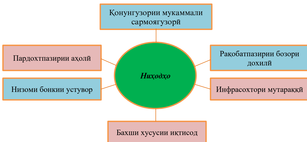
Расми 1.5. Таснифи ниҳодҳои, ки ба ташаккулёбии фазои сармоягузорӣ таъсири мусбат мерасонанд

Тоҷикистон дар айни замон барои ташаккули фазои мусоиди сармоягузорӣ дорои имкониятҳои васеъ мебошад. Ба ин захираҳои фаровони табиӣ кишвар, маърифати молиявии аҳоли, бартариятҳои воқеии иҷтимоӣ-иқтисодии мамлакат, ҳамкориҳои васеъ ва ҳамҷониба бо кишварҳои шарик ба ҷалби сармоягузорӣ, аз ҷумла сармоягузориҳои мустақими хориҷӣ мусоидат мекунанд. Бинобар ин, барои ташаккули фазои мусоиди сармоягузорӣ дар кишвар заминаҳои устувор аз ҷабби таъмин кардани рушди инфрасохтори бозор, таъсиси муассисаҳои самараноки молиявӣ, биржаҳо ва ширкатҳои суғуртавӣ зарур дониста мешавад. Таҳлили ниҳодҳои, ки ба ташаккули фазои мусоиди сармоягузорӣ таъсир мерасонанд, барои ба низоми муайян даровардани онҳо мусоидат менамоянд (расми 1.5).