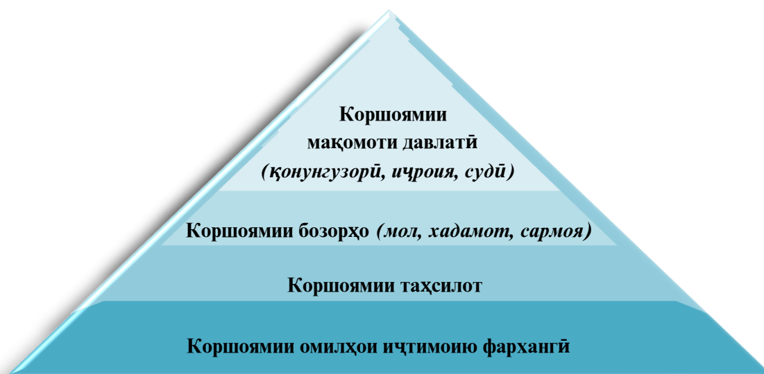
Расми 1.2. Пирамидаи коршоями ниҳодҳо (институтҳо) барои сармоягузори мустақими хориҷӣ

коршоямиро дар бар мегирад: иҷтимоию фарҳангӣ; таҳсилотӣ; бозорӣ; мақомоти давлатӣ (расми 1.2). Дар ҳамаи ин чор соҳа баъзе мамлакатҳо шояд бартарӣ, дигарҳо – камбудӣ дошта бошанд.