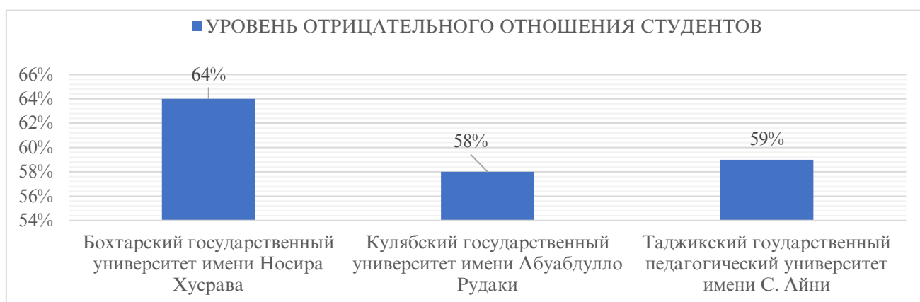
Диаграмма 1. Уровень отрицательного отношения студентов первого курса к физической культуре

Бохтарском государственном университете, 58,2% в Кулябском государственном университете и 59,3% в Таджикском государственном педагогическом университете) считают предмет «Физкультура» «как несерьезный и необоснованный. Эти данные свидетельствуют о том, что студенты первого курса в целом не придают большого значения поддержанию здорового образа жизни. Однако по мере взросления и близкого взаимодействия с преподавателями, ведущими этот предмет, наблюдается увеличение доли студентов, чье мнение кардинально меняется.