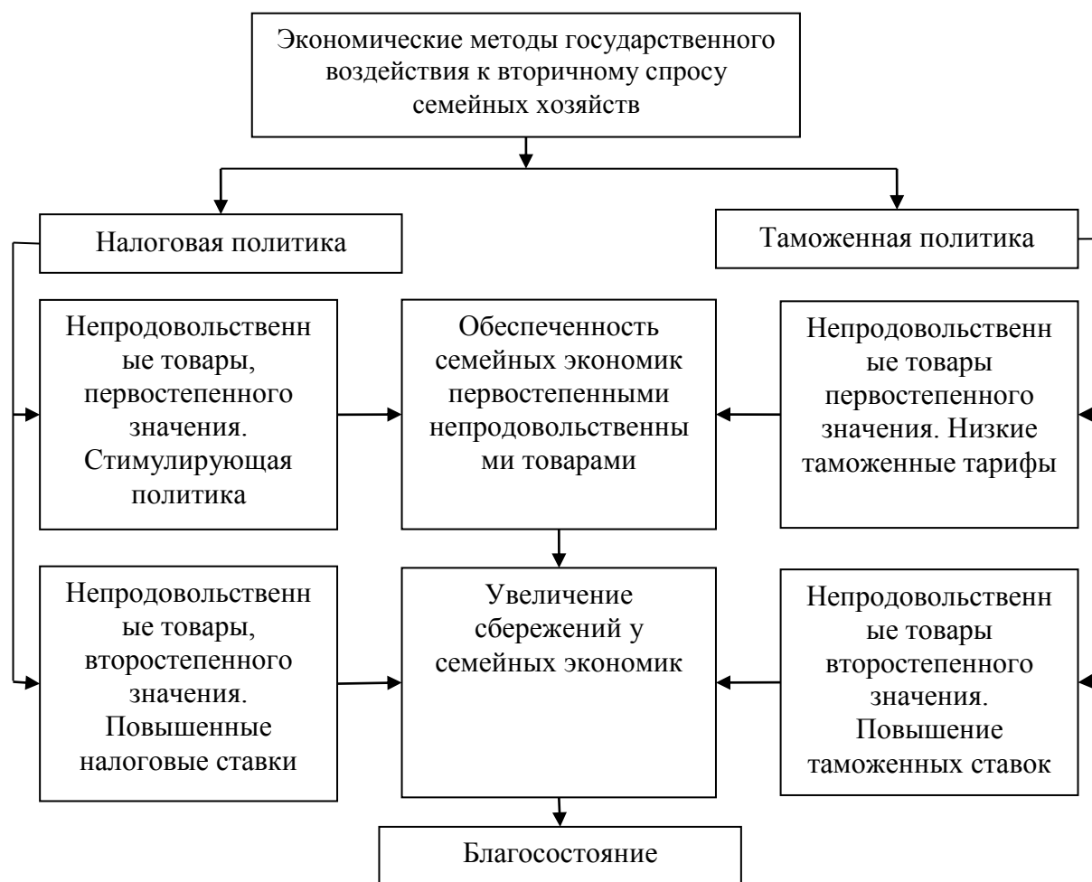
Рисунок 1. - Механизм регулирования непродовольственного спроса домашних хозяйств

Оно реализовывается на основе вышеприведенной классификации непродовольственных товаров, которые как объект регулирования вторичный уровень спроса семейной экономики на них выступает (рис. 1).