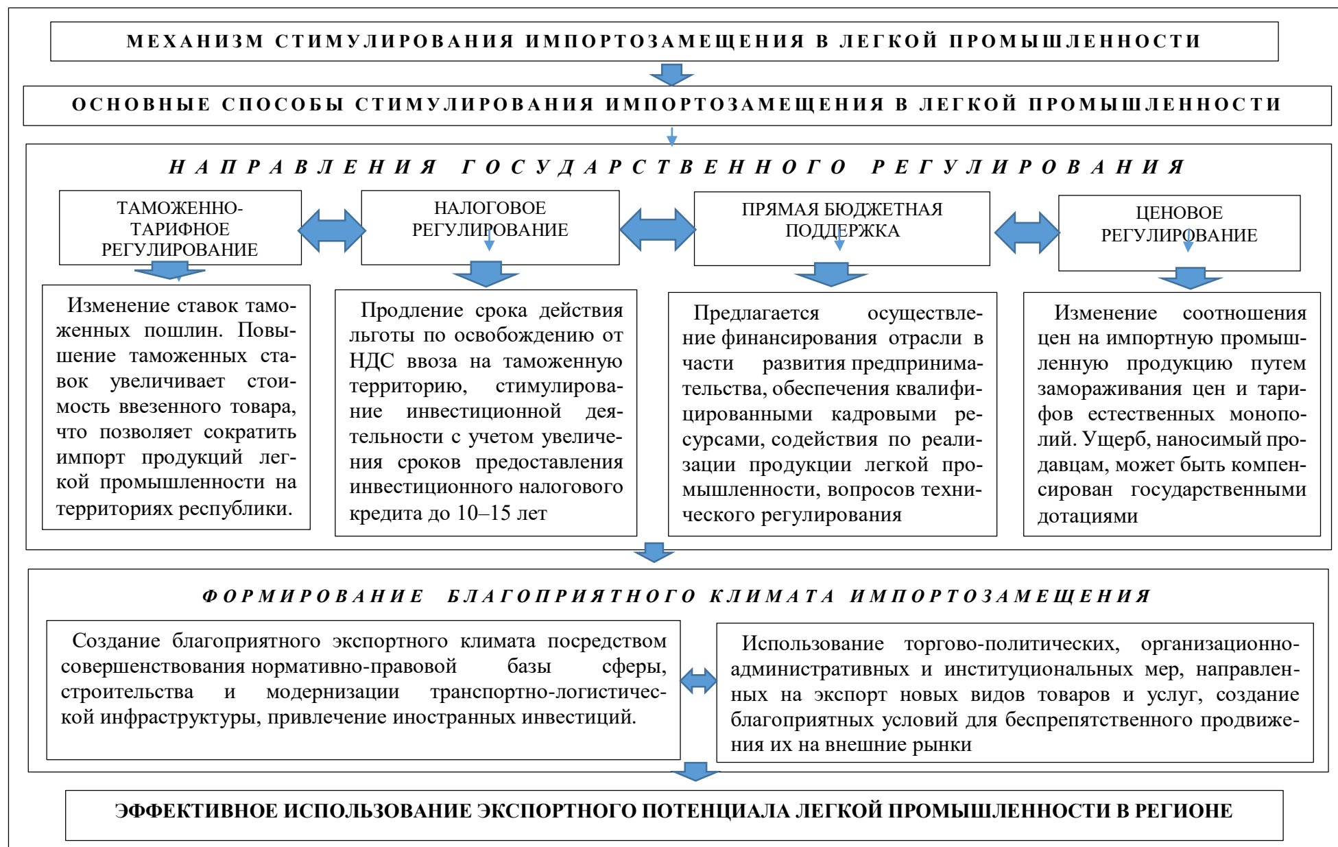
Рис. 2. Развитие механизма стимулирования импортозамещения в легкой промышленности региона