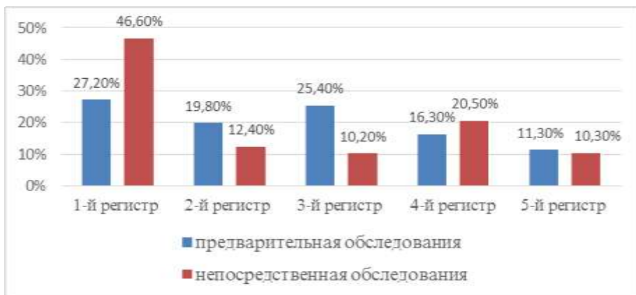
Диаграмма 1. Данные «предварительное обследование» и «непосредственное обследование» по показателям методики ММРІ

Из анализа данных мы видим, что происходит значительное изменение психологических особенностей личности. Если в «предварительном обследовании» представители 1-ого регистра, включенные в категорию «рекомендуемые в первую очередь», составляет 27,2%, то в «непосредственном обследовании» этот показатель составляет 46,6%, то есть переход из других регистров на первый регистр значительный. Такое положение означает, что улучшение (адаптация к требованиям психограммы) личностных качеств наблюдается по истечении времени. Наблюдается также увеличение числа четвертых регистров, с периода «предварительного обследования» до периода «непосредственного обследования» с 16,3% до 20,5%. Учитывая, что в 5-ом регистре не было внесено никаких существенных изменений, можно сказать, что увеличение количества лиц в «четвертом» регистре в «непосредственном обследовании» из числа представителей регистров 1, 2 и 3 означает, что стремится на акцентуацию сильного регистра, то есть акцентуации качеств личности. В регистрах 2 и 3 в количестве испытуемых наблюдалось уменьшение с «предварительного обследования» до «непосредственного обследования».